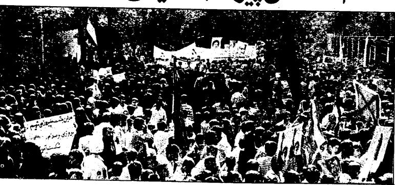
بقیه در صفحه ۱۰